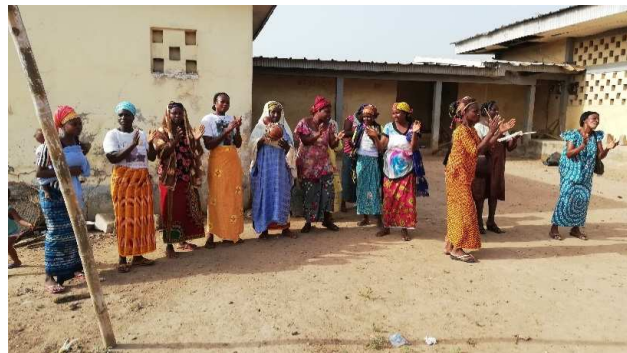
Présentation : Seam 2019