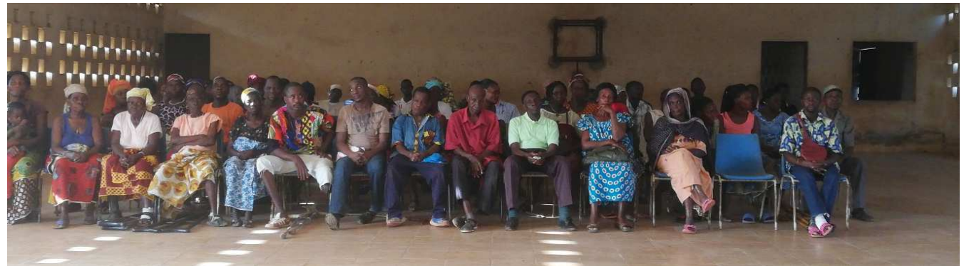
Illustrations : session des SEAM au village de Duquesne Crémone en Côte d'Ivoire

Le rapporteur en fait une synthèse écrite dans l'espace de discussion (chat)